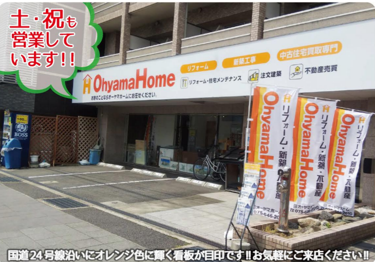
国道24号線沿いにオレンジ色に輝く看板が目印です!!お気軽にご来店ください!!

・宅地建物取引士・建築士・施工管理技士・ファイナンシャルプランナー・不動産賃貸管理士がいるお店